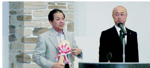
ライオンズキー引継ぎ式