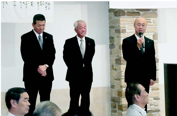
三役の皆様、お疲れ様でした。