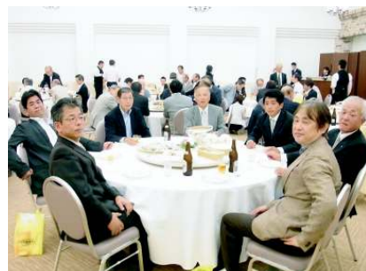
盛り上がるテーブル