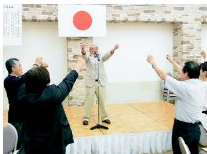
ライオンズローア